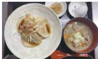
炭焼き焼きぶた定食(もつ煮つき)