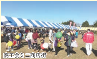
商工会三三商店街