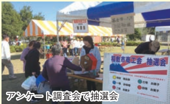
アンケート調査会で抽選会

商工会コーナーではアンケート調査を実施。ご協力頂いた方を対象に抽選会を行いました。また、工業部会では部会PRを行いました。参加協力いただきました会員の皆様、ありがとうございました。またご来場いただきました市民の皆様には感謝申し上げます。