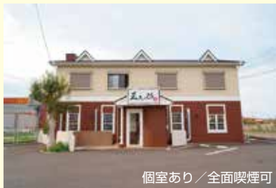
個室あり／全面喫煙可