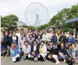
●6月視察研修会 (千葉県 ダイヤと花の大観覧車・よしもと幕張劇場他)