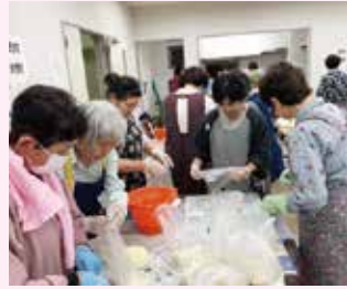
●5月ゴキブリ団子作り講習会