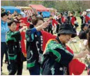
●4月 チューリップまつり踊り参加