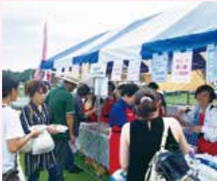
●8月 いなしき夏まつり模擬店出店