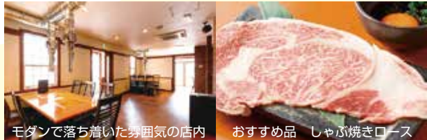
モダンで落ち着いた雰囲気の店内