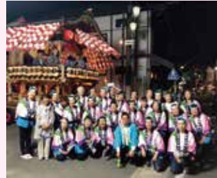
●7月 江戸崎祇園祭踊り参加